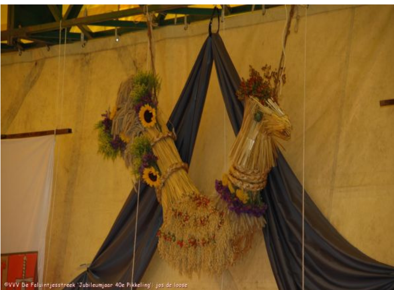
©VVV De Faluintjesstreek 'Jubileumjaar 40e Pikkeling' jos de loose

Werkgroep gastgezinnen: Ingrid Van Cauwenberghe 0477/38.14.88 ivancauwenberghe@hotmail